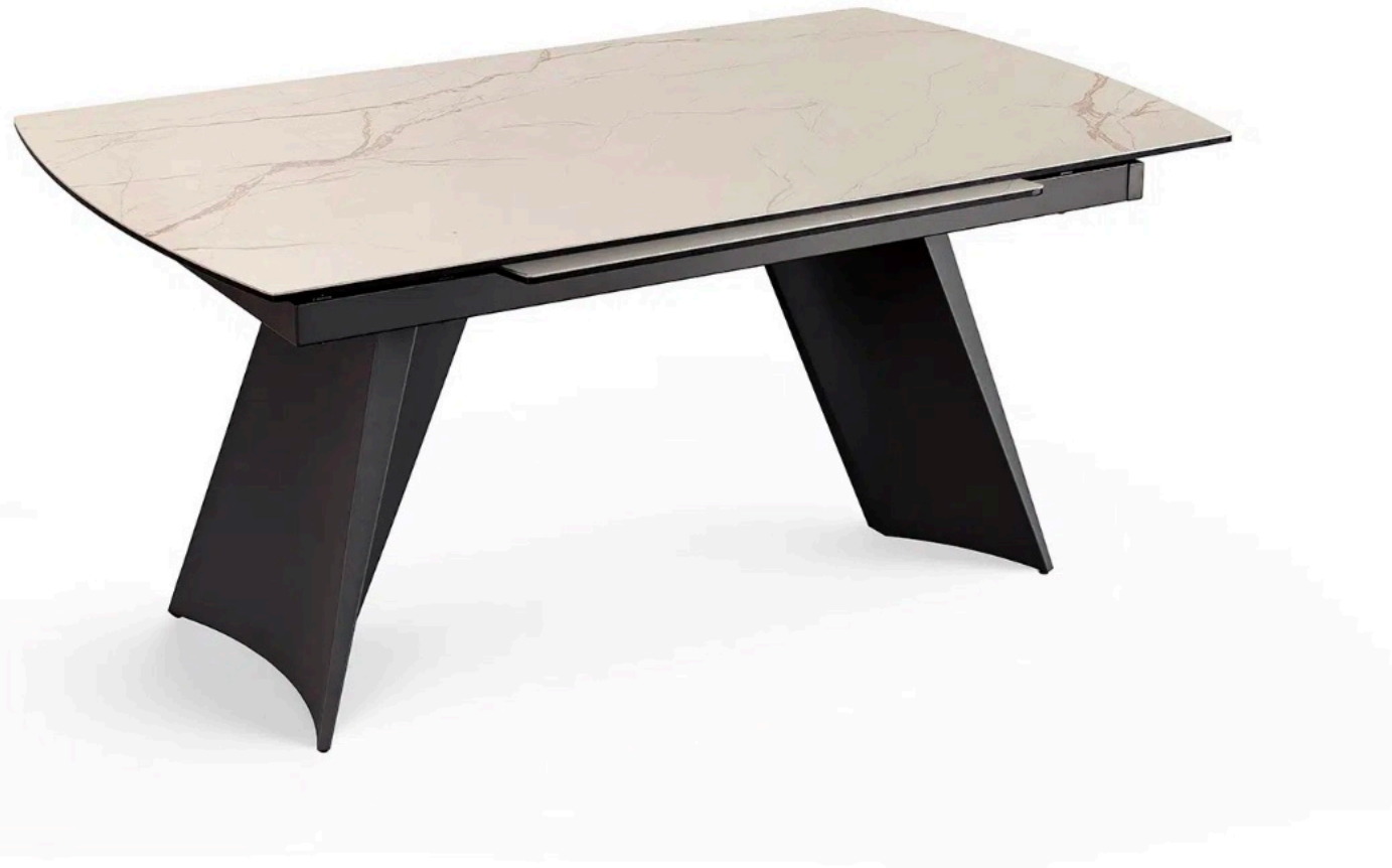
Table convexe en 170 x 100 Azalée 1 allonge rotative en bout de 85cm